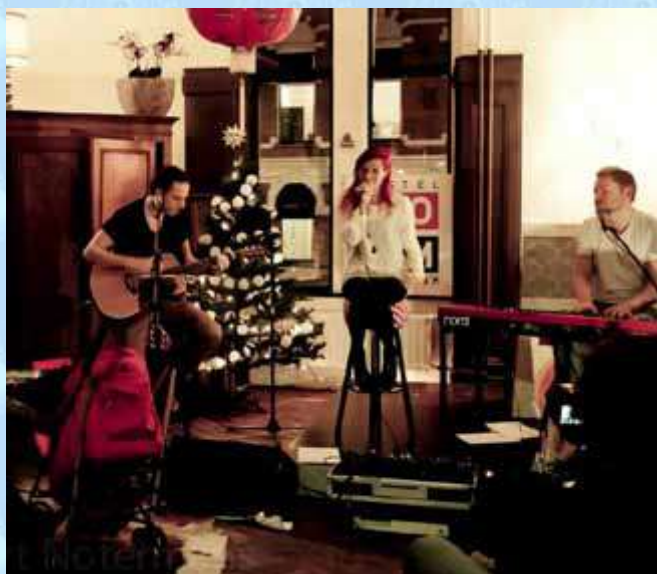
Ming's Pretty Heroes in Hostel ROOM

Vanaf 2013 is het Promotieplan onderdeel van het beleidsplan van de Popunie en opgenomen in het cultuurplan 2013-2016 van de gemeente Rotterdam. Met de bevindingen van het eerste jaar is het verder geoptimaliseerd onder de nieuwe naam Music Support Rotterdam. Hiermee kunnen we de komende jaren iets moois neerzetten en is de continuïteit gewaarborgd. Voor de talentontwikkeling en verlevendiging van de (binnen)stad is Music Support Rotterdam een belangrijk instrument. Zowel de ondernemers, de muzikanten en het Rotterdamse publiek profiteren hiervan!