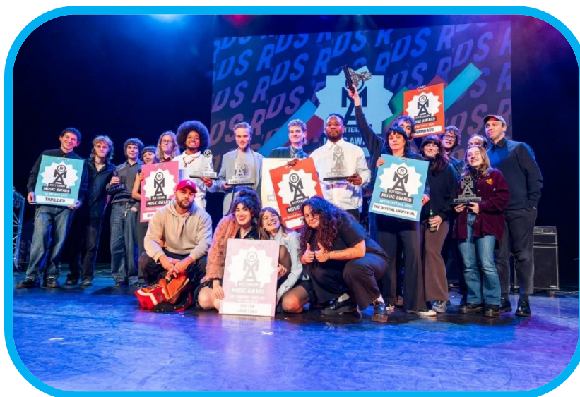
De prijswinnaars van de Rotterdam Music Awards 2025