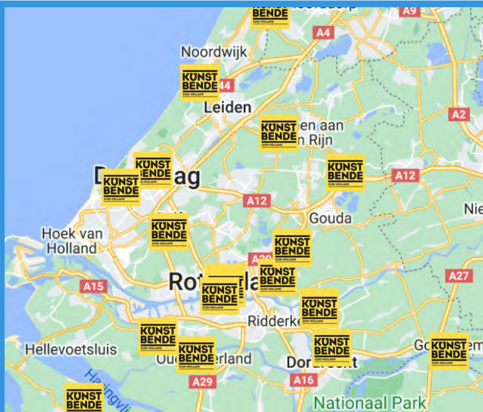
Gemeentelijke spreading deelnemers Kunstbende Zuid-Holland