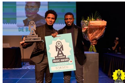
Djesco winnaar RMA De Belofte

De Rotterdam Music Awards zijn de popprijzen voor de Rotterdamse popsector en worden sinds 2014 uitgereikt. De awards zijn door de Popunie in het leven geroepen om enerzijds de kwaliteit en diversiteit van de Rotterdamse popscene te belichten en anderzijds de popsector positief in de schijnwerpers te zetten. Het publiek kon medio november tien dagen lang online stemmen op 81 genomineerden in zes categorieën: Beste Podium, Beste Festival, Beste Clubavond, Beste Track, Beste Album en de Exportprijs. De zevende categorie De Belofte bestond uit de vier jurywinnaars van de Sena Performers Grote Prijs van Rotterdam en werd door een vakjury bepaald. Deze categorie werd i.s.m. Music Matters georganiseerd.