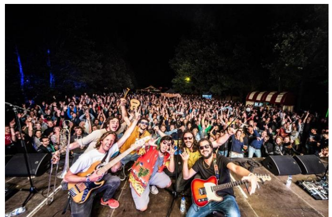
Los Paja Brava op Oerol

In totaal hebben 16 acts opgetreden, bestaande uit 68 muzikanten. De acts hebben gespeeld op vijf spraakmakende festivals. Het is een keurmerk voor bands om dergelijke grote optredens te kunnen delen op hun socials, ook voor toekomstige boekingen. Twee van de vijf festivals vonden plaats buiten Rotterdam, belangrijk voor de doorstroming van Rotterdams toptalent naar andere Nederlandse steden. Buiten je eigen stad/regio spelen is namelijk één van de moeilijkste en tevens belangrijkste vervolgstappen in de carrières van talentvolle muzikanten. Dankzij de sponsoring van Sena kan de gagenorm van € 250,- per muzikant worden toegepast, wat de muzikanten weer kunnen investeren in hun carrière. Het aantal bezoekers is niet nauwkeurig te bepalen, omdat het merendeels gratis toegankelijke evenementen zijn en de bezoekers doorlopend van podium wisselen. Onze acts staan ook niet op één vast podium, maar verspreid over de diverse podia op de events. Naar schatting 1.000 bezoekers per festival die onze Rotterdamse acts bewonderen is laag ingeschat.